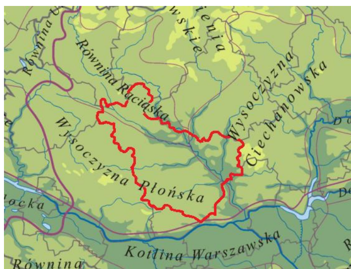
Ryc.2. Obszar LGD na tle mapy hipsometrycznej z mezoregionami wg J. Kondrackiego