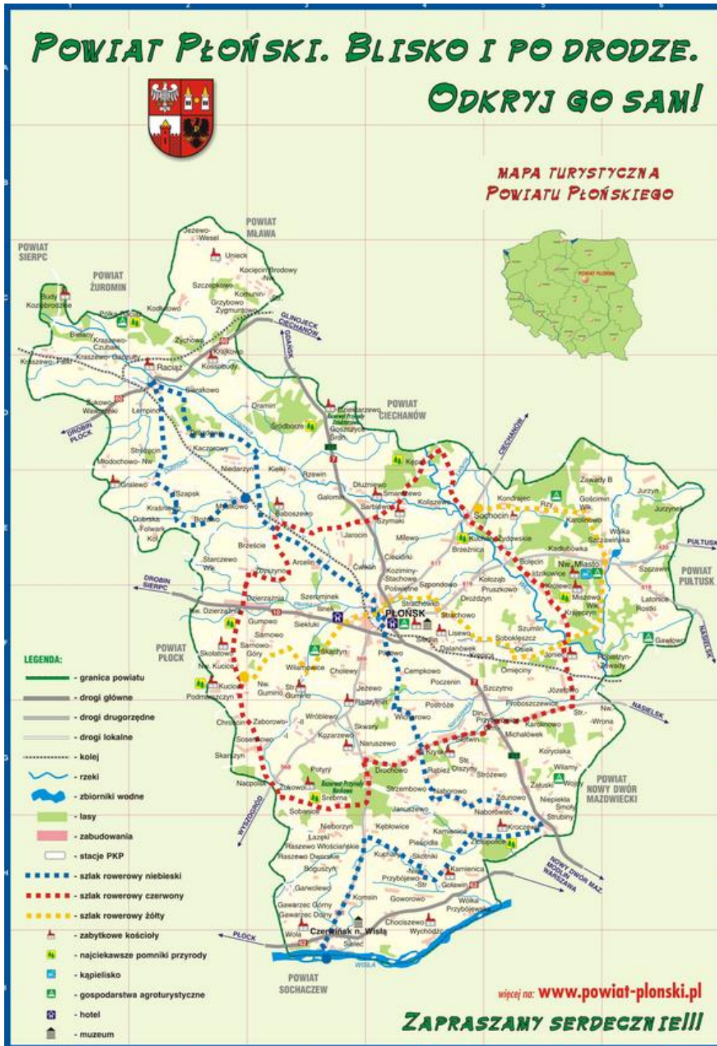
Ryc. 3. Mapa turystyczna powiatu płońskiego.