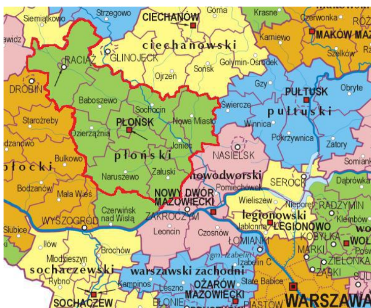
Ryc. 1. Obszar LGD Przyjazne Mazowsze w układzie administracyjnym