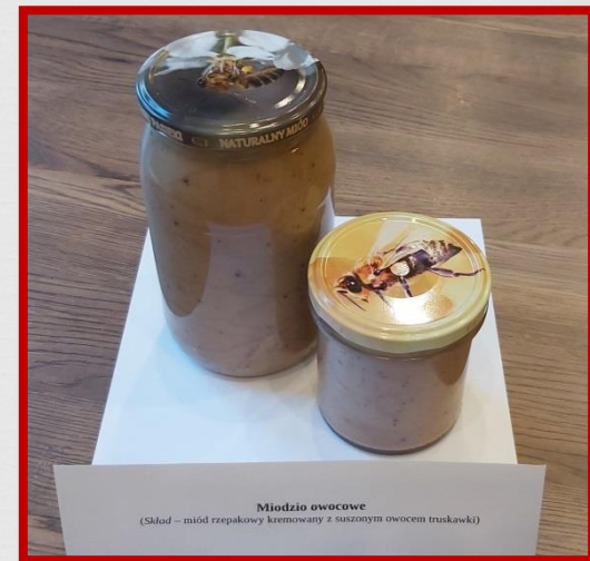
Miodzio owocowe (Skład – miód rzepakowy kremowany z suszonym owocem truskawki)