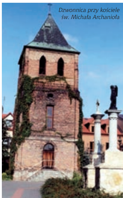
Dzwonnica przy kościele św. Michała Archanioła

Sienkiewiczówka w Poświętnem – zespół podworski: dwór murowany z XIX/XX w., oficyna murowana z końca XIX w., budynek gospodarczy murowany, pozostałości parku z końca XIX w.