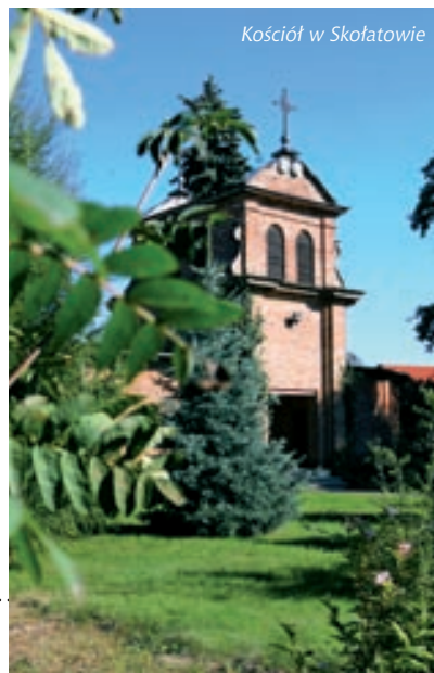
Kościół w Skołatowie

– dwór murowany z ok. 1920 r. – piwnice murowane z początku XX w.