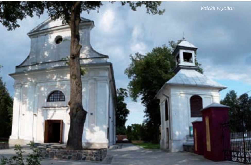
Kościół w Jońcu