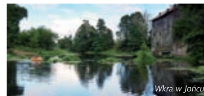
Wkra w Jońcu

Trasa rozpoczyna się w miejscowości Joniec w przystani kajakowej „Mrzonka”. Dalej przebiega przez Królewo, do miejscowości Sobieski. W Królewie wart obejrzenia jest zabytkowy kościół pochodzący z około XVI w. Trasa kończy się w miejscowości Sobieski w przystani kajakowej „Kaja”, gdzie można na koniec podróży smacznie zjeść i odpocząć.