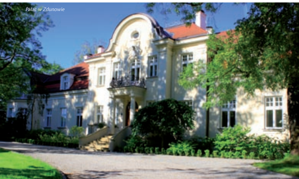
Pałac w Zdunowie