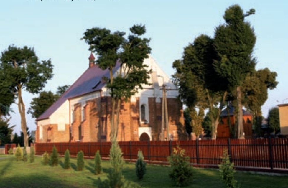
Kościół pw. św. Trójcy w Nowym Mieście

– Kościół Parafialny pw. św. Trójcy z XV w. – dzwonnica z 1863 r. – cmentarz parafialny rzymskokatolicki z 2. połowy XIX w.