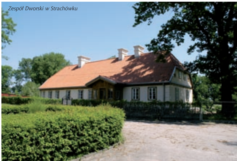
Zespól Dworski w Strachówku