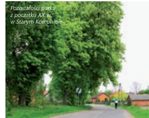
Pozostałości parku z początku XX w. w Starym Komuninie

Oferta: główną atrakcją są zajęcia z końmi – weekendy i wakacje w siodle; dzieci i młodzież na turnusach wakacyjnych uczone są nie tylko jazdy od podstaw, ale również doskonałą techniki ujeżdżeniowej, pracują z końmi oraz uczą się ich oporządzania, zdobywają wiedzę teoretyczną z zakresu jeździectwa poprzez wykłady i filmy instruktażowe; dla osób zaawansowanych organizowane są również rajdy oraz przejażdżki w terenie; organizacja