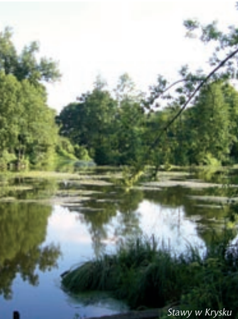
Stawy w Krysku

Oferta: miejsce wypoczynku dla dzieci, minizoo.