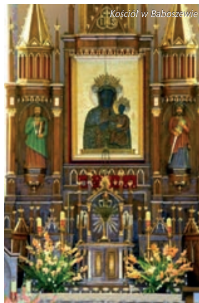
Kościół w Baboszewie

– dwór z początku XX w.; w jego najbliższej okolicy zachowało się kilka przykładów starodrzewia.