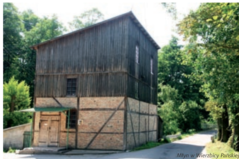
Młyn w Wierzbicy Pańskiej