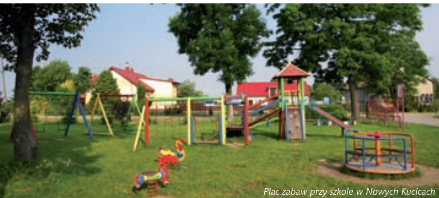
Plac zabaw przy szkole w Nowych Kucicach

Oprócz parków na terenie gminy zarejestrowano pomniki przyrody żywej (między innymi pojedyncze drzewa i grupy drzew) oraz pomniki przyrody nieożywionej (głazy narzutowe): trzy jesiony wyniosłe we wsi Pomianowo; głaz narzutowy; granit różowy gruboziarnisty we wsi Pomianowo. Zarejestrowane pomniki przyrody podlegają ścisłej ochronie i pozostają pod kontrolą Wojewódzkiego Konserwatora Zabytków. Za podlegające ochronie zostały uznane dwa użytki ekologiczne o łącznej powierzchni 0,86 ha: użytek ekologiczny o powierzchni 0,25 ha zlokalizowany na gruntach wsi Nowe Kucice; użytek ekologiczny o powierzchni 0,61 ha zlokalizowany na gruntach wsi Siekluki.