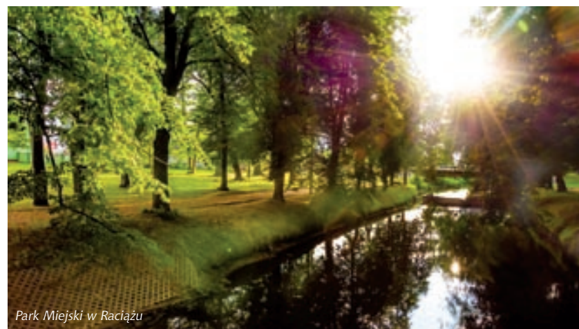
Park Miejski w Raciążu