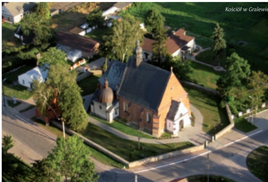
Kościół w Gralewie

– Kościół Parafialny pw. św. Jakuba Apostoła z XIX w.