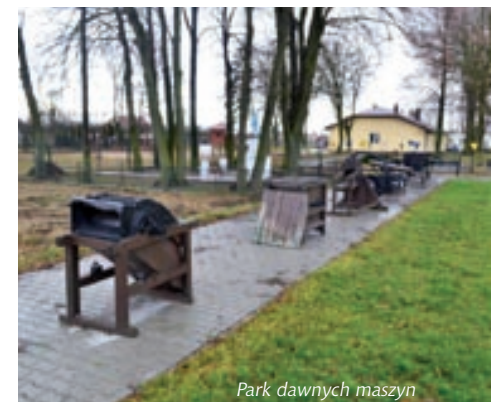
Park dawnych maszyn

Głównym celem jego utworzenia było ocalenie od bezpowrotnego zniszczenia i zapomnienia maszyn, które pokazują historię i tradycję rolnictwa w naszym regionie, jego wysoką kulturę oraz ciężką pracę ludzi uprawiających rolę. Jest to miejsce zadumy, gdzie wnukowie mają okazję wysłuchać niejednej ciekawej historii swoich dziadków.