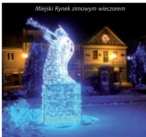
Miejski Rynek zimowym wieczorem

XIX-wieczny park w Poświętnem wchodzi w skład zespołu podworskiego, wpisane go do rejestru zabytków województwa mazowieckiego ze względu na wartości historyczne, przyrodnicze oraz krajobrazowe. Zabytkowy układ zieleni złożony jest z dwóch parków – północnego, stanowiącego otoczenie dworu „Sienkiewiczówki”, południowego – przedmiotowego parku Gminy Miasto Płońsk oraz łączących oba kompleksy parkowych alei lipowych. Lipy