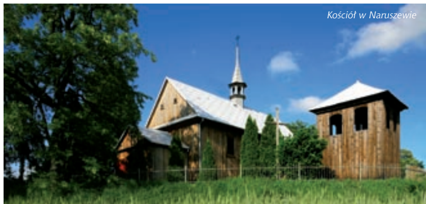
Kościół w Naruszewie