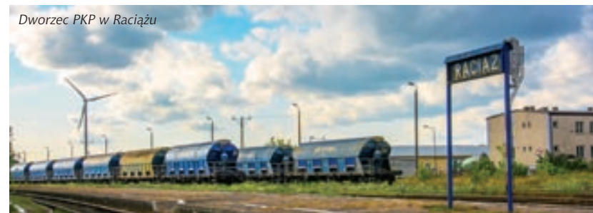
Dworzec PKP w Raciążu

Interesującym miejscem jest również ulica Warszawska stanowiąca niegdyś rewir dla ludności żydowskiej ustanowiony przez władze carskie w pierwszej połowie XIX w.