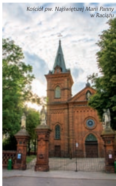
Kościół pw. Najświętszej Marii Panny w Raciążu