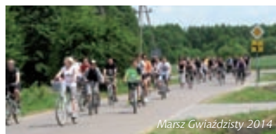
Marsz Gwiazdzysty 2014