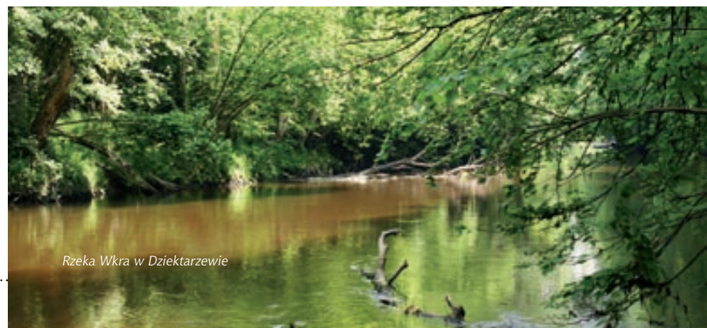
Rzeka Wkra w Dziektarzewie

i Goszczyce Poświętne do Dziektarzewa, niewątpliwie jednego z najbardziej urokliwych pod względem przyrodniczym miejsc w gminie Baboszewo. Godnym uwagi obiektem jest zabytkowy kościół św. Katarzyny wraz z otaczającym go obszarem, zabytkowa dzwonnica i jedyny w gminie zegar słoneczny. Dalej warto udać się do Parku Krajobrazowego, Rezerwatu Przyrody oraz nad rzekę Wkrę. Jadąc przez teren parku, należy kierować się do miejscowości Rybitwy, gdzie po przecięciu trasy E-7 jedzie się w kierunku Śródborza. Przez piękne lasy warto udać się do miejscowości Kiełki, gdzie znajdują się pozostałości parku podworskiego. Dalej przez miejscowość Cieszkowo-Kolonia dojeżdża się do Mystkowa, gdzie warto zobaczyć zabytkowy dwór z 1921 r. Następnie przez miejscowości Cywiny Wojskie i Kowale należy udać się do Brześcia Małego, gdzie znajduje się hodowla koni. Następnie, kierując się przez Brzeście do Baboszewa, po drodze mijają się kompleks szkolny oraz Halę Sportowo-Widowską. Wycieczka kończy się przy Kościele w Baboszewie.