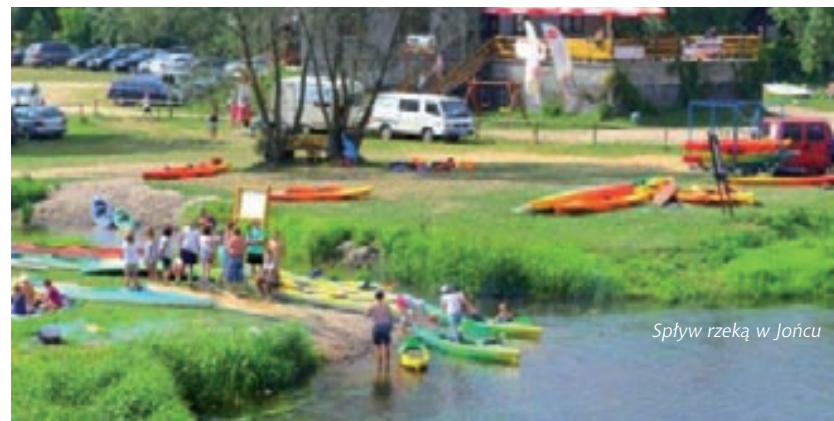
Spływ rzeką w Jońcu

Oferta: 28 miejsc noclegowych; wypożyczalnia rowerów i sprzętu rekreacyjnego, wypożyczalnia kajaków, organizacja spływów kajakowych boisko do piłki siatkowej, badmintona; możliwość organizacji ogniska lub grilla; pole namiotowe wyposażone w sanitariaty; parking; pokoje gościnne; wiata nad rzeką; bar małej gastronomii.