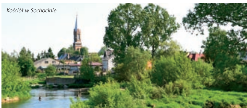
Kościół w Sochocinie

– Kościół Parafialny pw. św. Jana Chrzciciela z początku XX w., cmentarz przykościelny, ogrodzenie wokół kościoła z dzwonnica z 1895 r., plebania murowana z początku XX w.