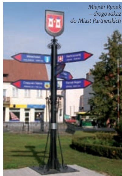
Miejski Rynek – drogowy do Miast Partnerskich

Oferta: 5 pokoi dla około 20 osób; miejsca noclegowe w obiekcie znajdują się w części hali sportowej nad siłownią; są one przeznaczone głównie dla zespołów i drużyn sportowych; mogą z nich korzystać również np. przejeżdżające przez Płońsk wycieczki.