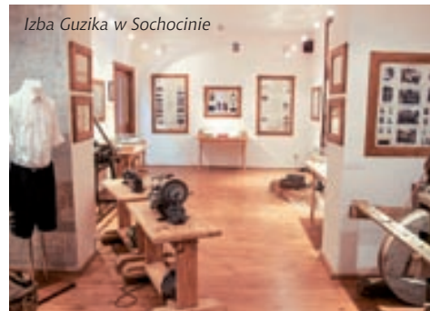
Izba Guzika w Sochocinie

Budynek Gminnego Ośrodka Kultury ul. Guzikarzy 8A, 09–110 Sochocin Swoiste muzeum historii Sochocina i skarbnica tradycji guzikarskich.