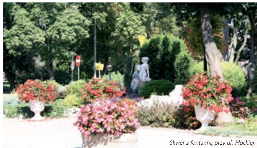
Skwer z fontanną przy ul. Płockiej

Trasy pieszo-rowerowe o łącznej długości 5,5 km: w parku przy ul. Kopernika; przy zbiorniku wodnym Rutki i ogródku jordanowskim; między Manhattanem a rzeką Płonką