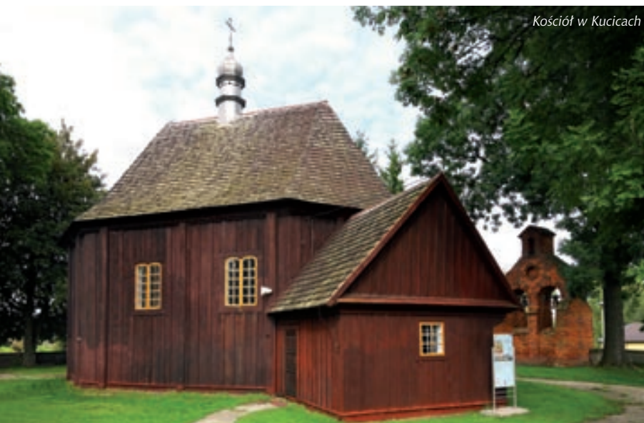
Kościół w Kucicach

– zespół Kościoła Filialnego pw. św. Michała Archanioła : kościół drewniany 1783–1850 r., dzwonnica murowana z początku XX w., cmentarz przykościelny, sala katechetyczna murowana z początku XX w. – pozostałości zespołu dworskiego , w tym parku z 2. połowy XIX w.