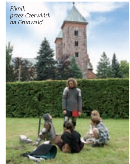
Piknik przez Czerwińsk na Grunwald