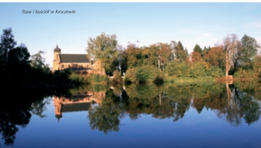
Staw i kościół w Kroczewie