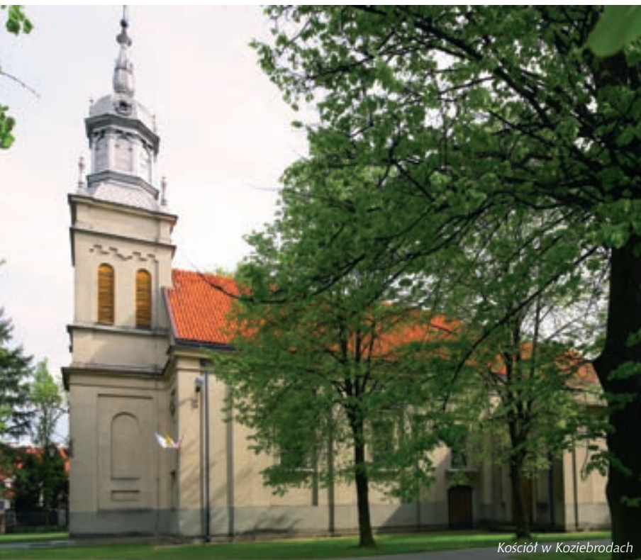
Kościół w Koziebrodach