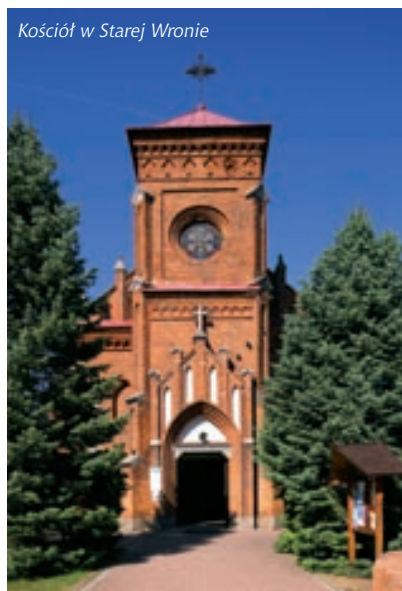
Kościół w Starej Wronie

– Kościół Parafialny pw. Przemienienia Pańskiego z XIX/XX w.