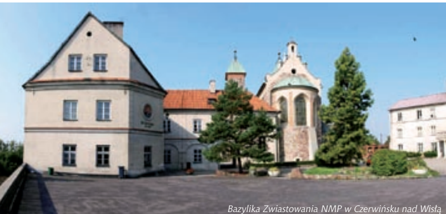
Bazylika Zwiastowania NMP w Czerwińsku nad Wisłą

– zespół Kościoła Parafialnego pw. św. Bartłomieja: kościół drewniany z XIX w., dzwonnica drewniana z 1. połowy XIX w., cmentarz przykościelny z 2. połowy XIX w., plebania murowana z 2. połowy XIX w., cmentarz parafialny z 1. połowy XIX w.