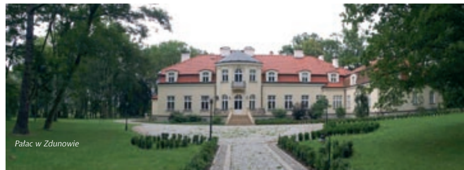
Pałac w Zdunowie

Hotel położony jest na naturalnej polanie leśnej o powierzchni 10 ha, w odległości ok. 70 km od Warszawy, 40 km od lotniska w Modlinie, 12 km od Płońska oraz 2 km od rzeki Wkry. Cechuje go nowoczesna architektura w stylu skandynawskim, wykorzystująca naturalne materiały. Posiada 45 pokoi, restaurację, bar, basen wewnętrzny i zewnętrzny, spa.