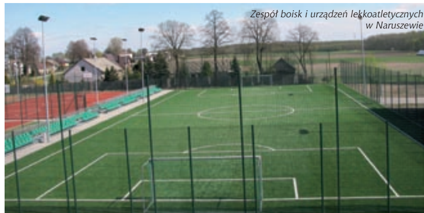
Zespół boisk i urządzeń lekkoatletycznych w Naruszewie