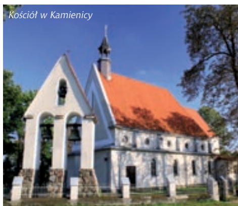
Kościół w Kamienicy

Na ścieżce organizowane są zajęcia terenowe dla uczniów ze szkół powiatu płońskiego, korzystają z niej również turyści odwiedzający Gminę Załuski. W październiku 2009 r. istniejąca ścieżka piesza została rozbudowana o ścieżkę rowerową. Utworzonych zostało kolejnych 5 stanowisk edukacyjnych: