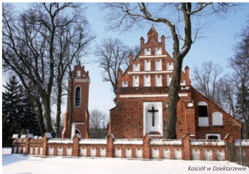
Kościół w Dziektarzewie