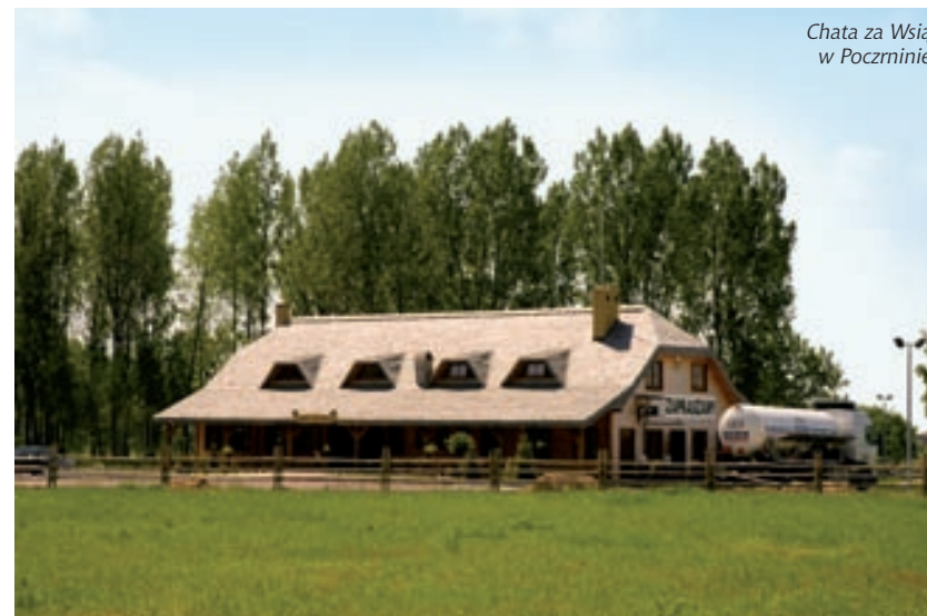
Chata za Wsią w Poczerninie

Oferta: 2 pokoje, wyżywienie, jazda konna (nauka jazdy, rajdy po okolicy).