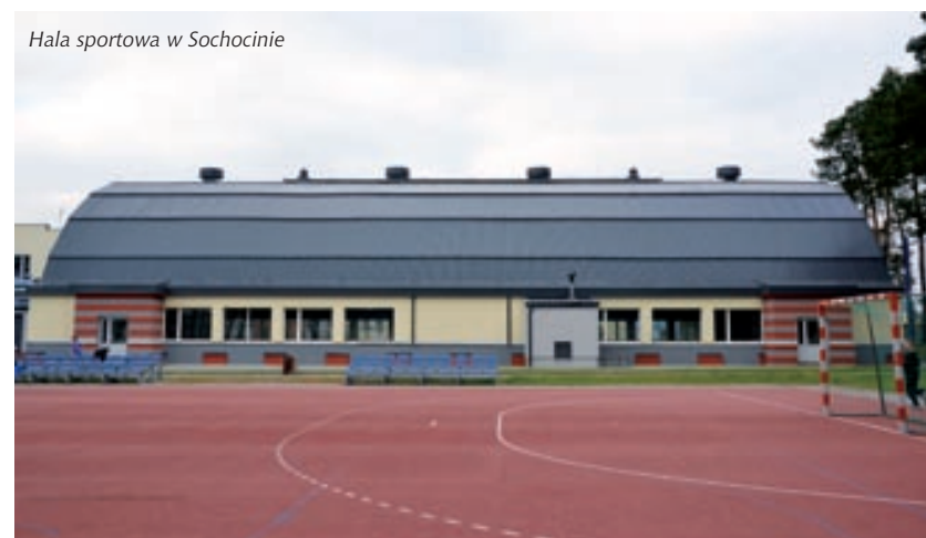
Hala sportowa w Sochocinie

Stadion na ok. 500 miejsc (w tym siedziska plastikowe). Płyta główna boiska w 2009 r. przeszła gruntowną modernizację. Obiekt położony w pobliżu lasu i głównej drogi. Nowa murawa wyposażona jest w system natrysków. Obok stadionu znajduje się hala sportowa, szatnie i hotel.