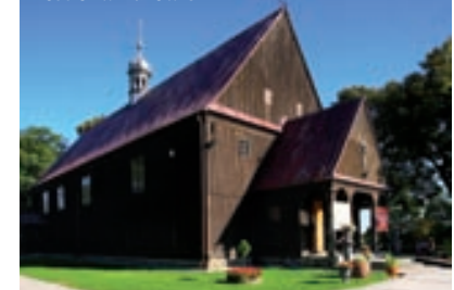
Kościół w Żukowie

Nie można wskazać dokładnej daty erygowania parafii, gdyż nie zachowały się żadne dokumenty. Parafia – ośrodek duszpasterski – istniała już w XIII w., a mogła powstać pod koniec XII w. Świadczy o tym wykopalisko – cmentarz z X–XIII w., gdzie obok um z prochami według obrządku słowiańskiego (pogańskiego) znajdują się szkielety chowane w trumnach według obrządku chrześcijańskiego.