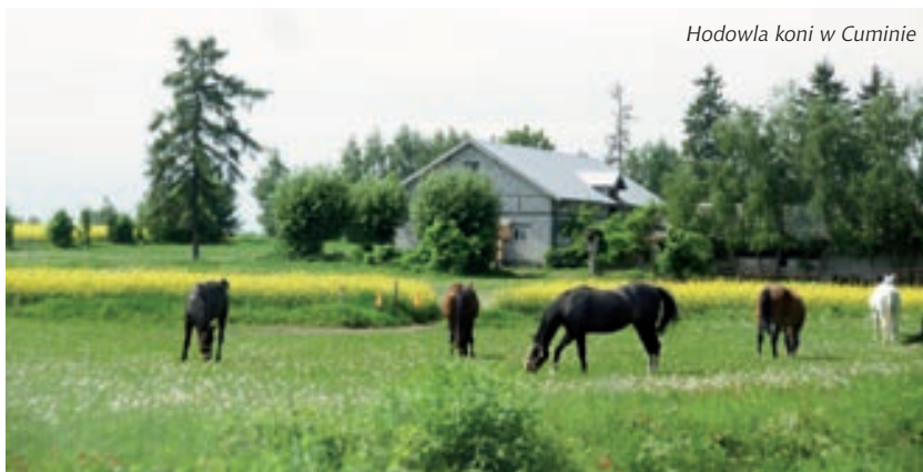
Hodowla koni w Cuminie

Na terenie gminy we wsiach: Niwa, Pomianowo, Gumowo, Kucice, Podmarszczyń, Gumino, Wierzbica, Wilamowice można spotkać dużo domów mieszkalnych i budynków przyzagrodowych z XIX/XX w. Większość zabytków świadczy, że na terenie gminy szlachta nie należała do najzamożniejszych rodów. Do dziś zachowała się nazwa jednej ze wsi – Wierzbica Szlachecka. Majątki jednak ulegały podziałom rodzinnym i stopniowo upodobniały się do dużych gospodarstw chłopskich. Z zachowanych na terenie gminy obiektów podworskich najstarszym jest dworek w Sieklukach z 2. połowy XIX w. Pozostałe pochodzą z XX w.