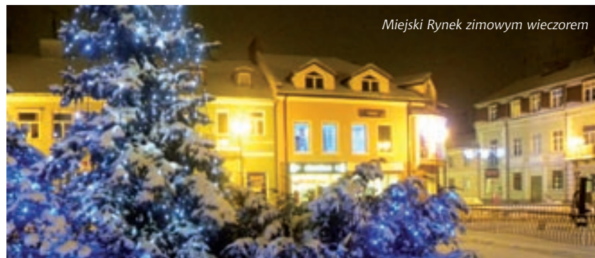
Miejski Rynek zimowym wieczorem

Lipa drobnolistna – grupa drzew rosnących na terenie parku, w części południowej, aleje wyznaczają granicę parku od strony wschodniej i zachodniej.