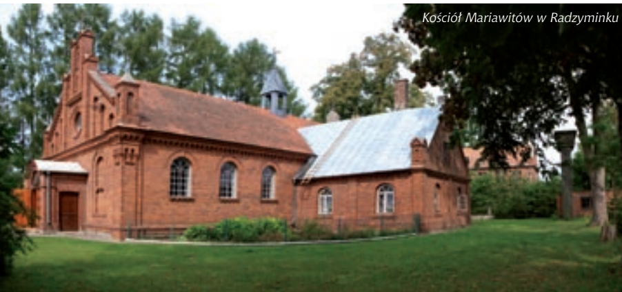
Kościół Mariawitów w Radzyminku