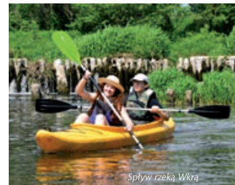
Spływ rzeką Wkrą

Dla rodzin z małymi dziećmi jest polecany krótki, 3-km odcinek z Kępy do Gutarzewa, bez potrzeby przenoszenia kajaków. Trasa rozpoczyna się w Kępie przed mostem drewnianym. Płynąc, mija się domki letniskowe na wysokich brzegach – ładne miejsca na biwaki, z dostępem do piaszczystych plaż. Przepływa się przez wieś Podsmardzewo z bardzo wysoką piaszczystą skarpią zwaną „Białą Górą”. Na prawym brzegu znajduje się sosnowy las. Z lewej strony jest ujście rzeki Łydni. Spływ można zakończyć na terenie wypożyczalni kajaków w Gutarzewie, gdzie jest wygospodarowane miejsce na ognisko, boisko do siatkówki i badmintonu, plac zabaw dla dzieci. Propozycja dłuższej trasy na odcinku 10 km z Gutarzewa do Bołęcina jest znacznie trudniejsza z uwagi na przeszkody w postaci elektrowni wodnej lub starych młynów. W Sochocinie, w miejscu spiętrzenia po dawnym młynie, jest konieczne przeniesienie kajaka przez kilka metrów. Na odcinku Sochocin – Bołęcina można obserwować na brzegach bogate zadrzewienie. W korycie zdarzają się duże głazy i kępy. Szerokim rozlewiskiem, do którego uchodzi z prawej strony rzeczka Płonka, dopływa się do elektrowni wodnej w Bołęcinie. Należy dopłynąć do lewego brzegu, by zakończyć spływ na tym odcinku.