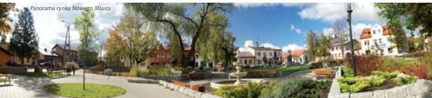
Panorama rynku Nowego Miasta

Na terenie ośrodka znajduje się również stajnia, która istnieje od ok. 20 lat – jest położona na 100 ha ziemi, z czego około 30 ha przeznaczonych jest na pastwiska dla koni; stajnia oferuje gościom: naukę jazdy konnej zarówno dla początkujących, jak i zaawansowanych pod nadzorem wykwalifikowanych instruktorów; organizację zawodów i konkursów jazdy konnej; obozy jeździeckie, majówki, czerwcówki i ferie; nocleg i wyżywienie.