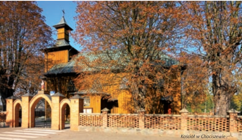
Kościół w Chociszewie

– zespół dworski: dwór murowany z 2. połowy XIX w., budynek folwarczny murowany z XIX w., park z 2. połowy XIX w. – cmentarz parafialny z połowy XIX w.