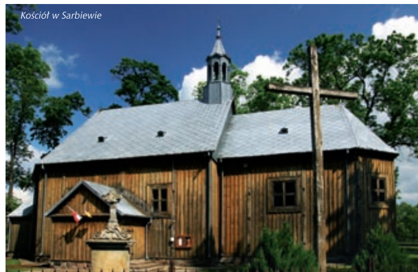
Kościół w Sarbiewie

Dwór zbudowany jest w stylu neorenesansu, mury z cegły, otynkowany, z mieszkalnym poddaszem. Do dawnego budynku zostały dobudowane pomieszczenia na potrzeby restauracji i hotelu. W parku najlepiej zachowana jest aleja lipowa z okazami liczącymi blisko 160 lat. Zespół podworski wpisany jest do rejestru zabytków.