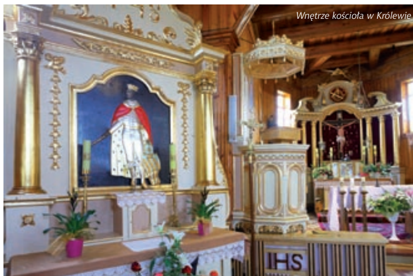
Wnętrze kościoła w Królewie