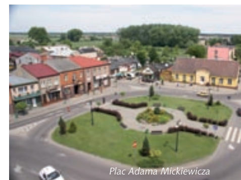
Plac Adama Mickiewicza