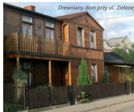
Drewniany dom przy ul. Zielonej