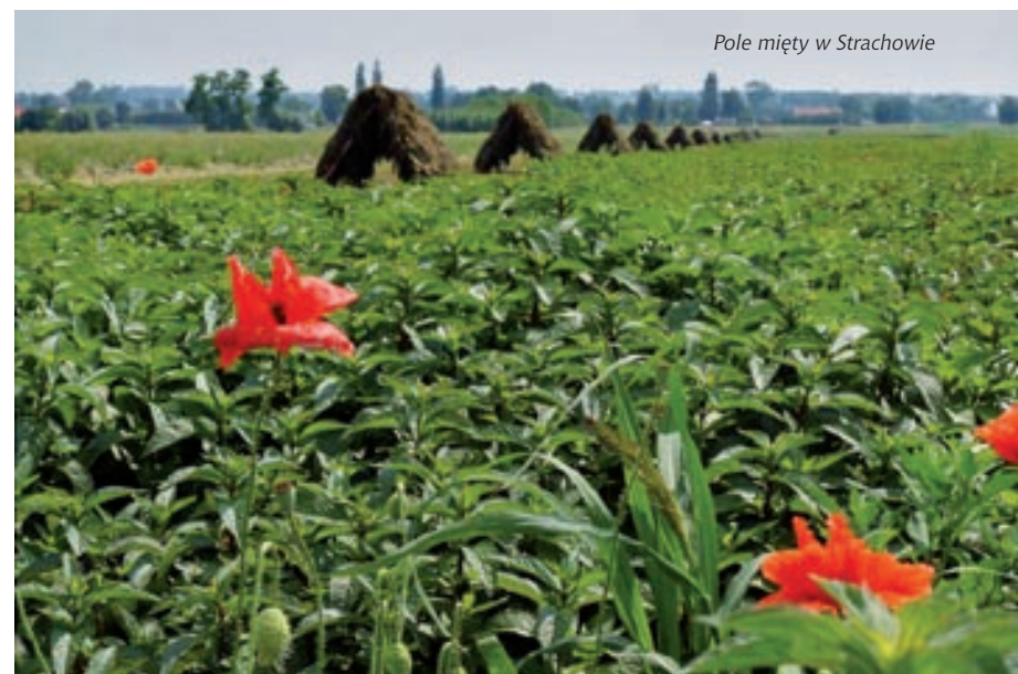
Pole mięty w Strachowie

Skrzynki 3A, Boński, 09–100 Płońsk tel. 539 721 735