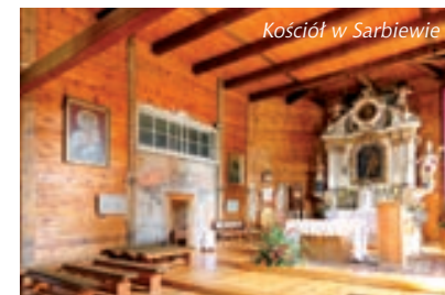
Kościół w Sarbiewie